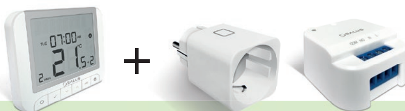
Thermostatserie Klassik – Funksystem einzeln mit Wochenprogrammierung

OHLE Infrarotheizungen mit über 250W Leistung, die ortsfest montiert sind, d.h. als Einzelraumheizung oder als vollwertiges Heizsystem genutzt werden, müssen immer mit einer der nachfolgend aufgeführten Thermostatkombinationen angesteuert werden: